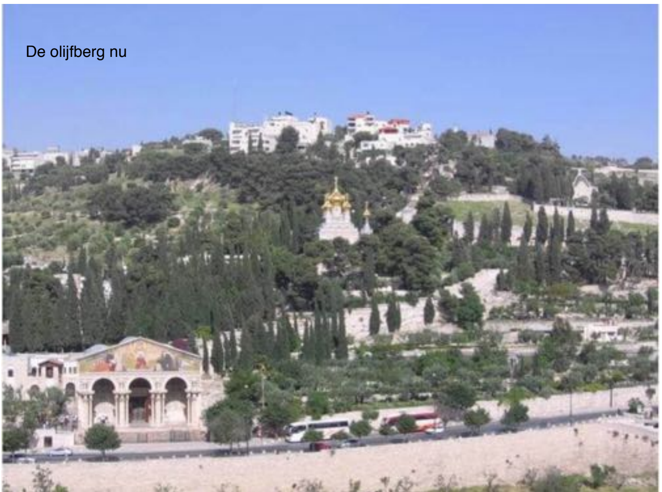
De olijfberg nu

Daarna bereidden de Essenen (en de discipelen) zich gedurende tien dagen in stilte voor op het Wekenfeest. En tijdens de nachtwake (die aan het Wekenfeest vooraf ging), bij het doorbreken van de eerste zonnestraal, beleefden de discipelen in het Ordehuis, samen met de Essenen, het wonder van Pinksteren : de Geest die neerdaalde en hen zijn eerste gaven schonk: een hoger bewustzijn. Nu werd hun lager ik verbonden met hun hoger zelf dat nog steeds boven hen zweefde.