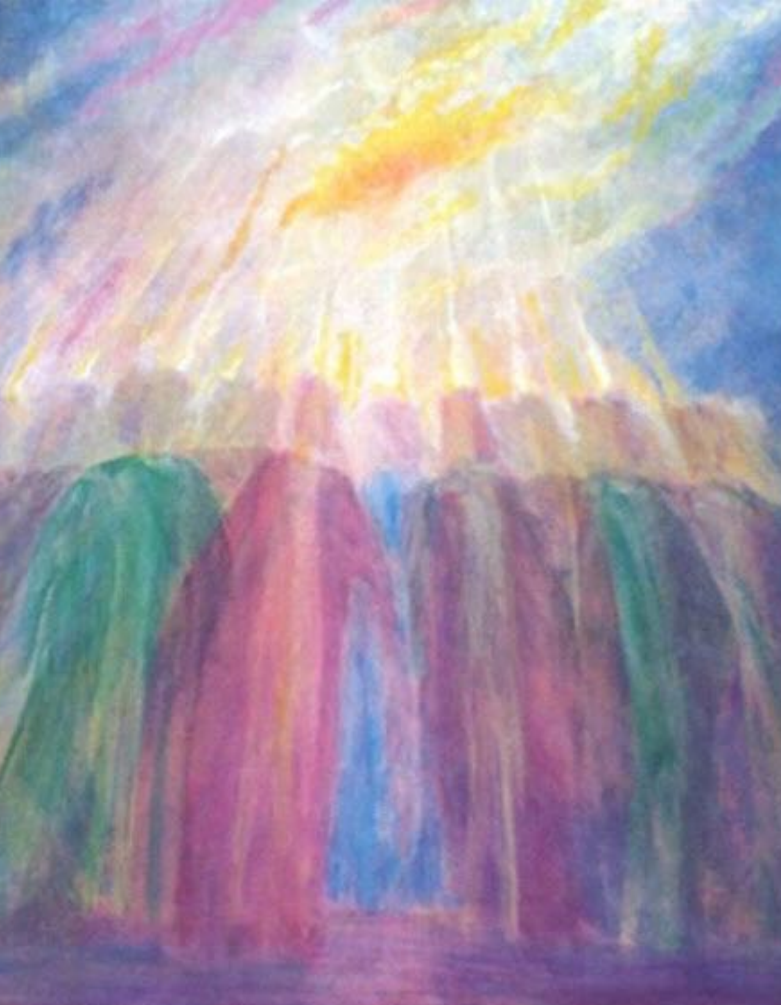
Pinksteren Ninetta Sombart