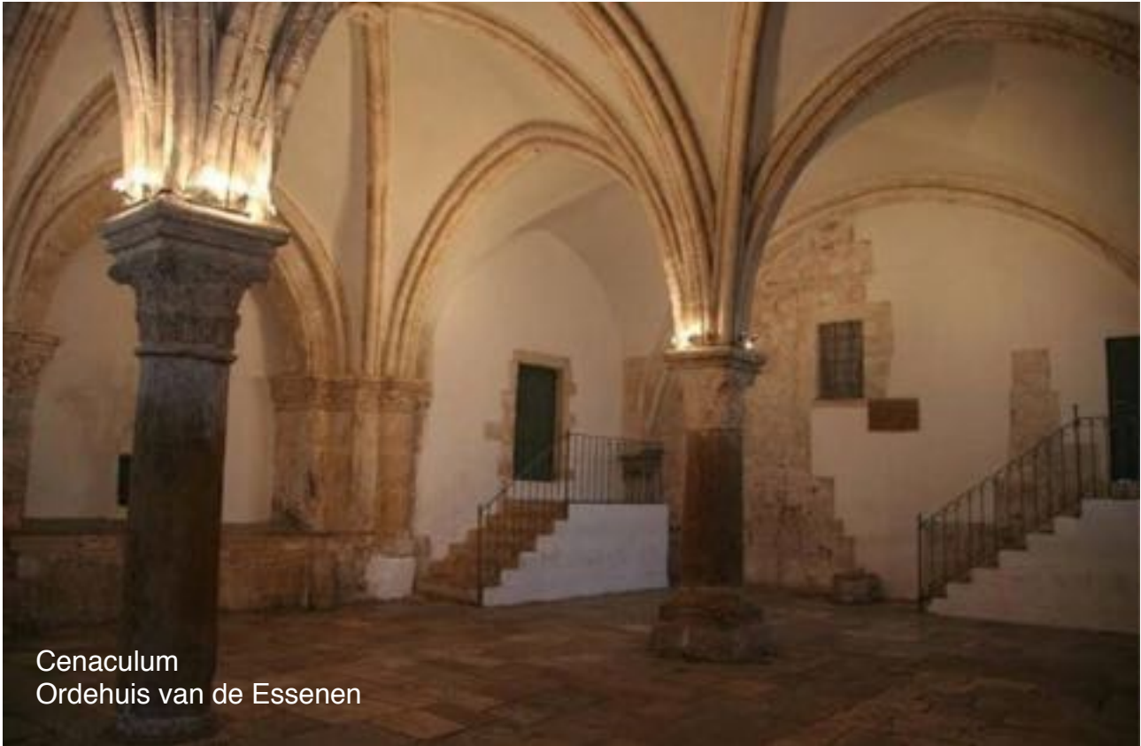
Cenaculum Ordehuis van de Essenen

Tien dagen vóór het Joodse Wekenfeest (het Oogstfeest dat in het christendom tot Pinksterfeest werd) trokken de Essenen – de witte broeders en zusters - van alle kanten uit het land op naar hun Ordehuis in Jeruzalem dat boven het graf van koning David ligt, en boven het vroegere Zonneheilgdom van Melchizedek. Eenmaal daar aangekomen, trokken ongeveer 500 Essenen , samen met de discipelen, op naar de top van de Olijfberg .